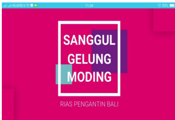
Gambar 3. tampilan awal video tutorial sanggul

Gambar 3 merupakan tampilan awal video tutorial pembuatan sanggul atau penataan rambut yang berisi tahapan pengerjaan dan alat bahan yang dibutuhkan untuk membuat penataan rambut yang sesuai dengan tema riasan pengantin Indonesia yang sedang dipelajari.