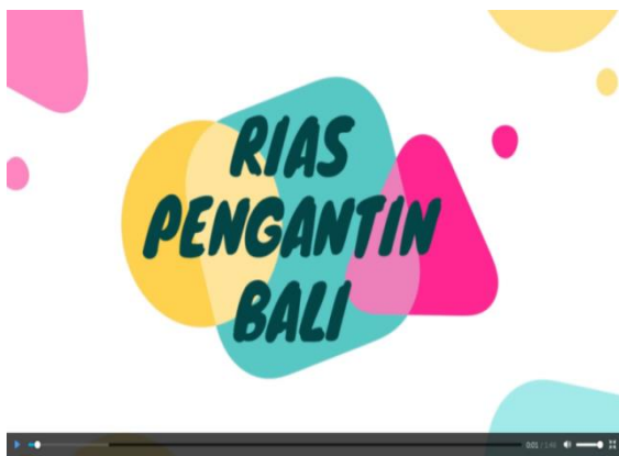
Gambar 2. tampilan awal video tutorial rias

Gambar 3 merupakan tampilan awal video tutorial pembuatan sanggul atau penataan rambut yang berisi tahapan pengerjaan dan alat bahan yang dibutuhkan untuk membuat penataan rambut yang sesuai dengan tema riasan pengantin Indonesia yang sedang dipelajari.